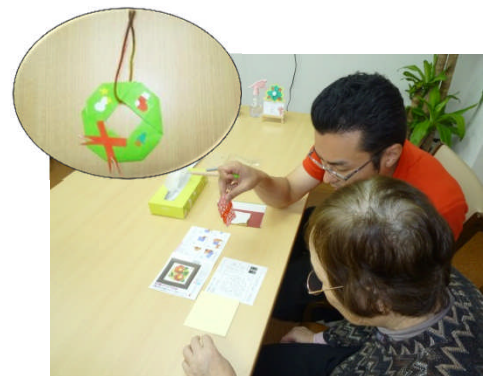
↑作業活動の途中経過↑