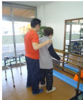
↑ 個別リハ風景 ↑