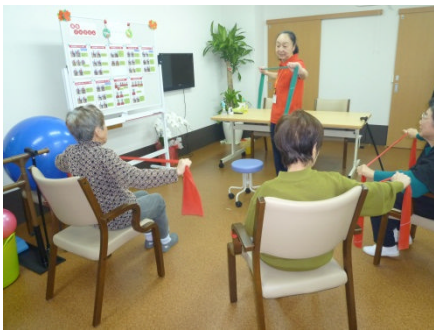
↑ 集団体操の様子 ↑

ありがたい事にたくさんの問い合わせをいただき、見学を始めお申込みいただいた利用者様達と日々楽しく過ごすことが出来ました。活動状況を定期便としてお知らせさせて頂きたいと思っております。