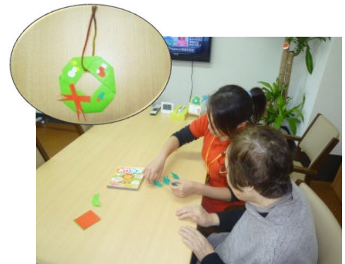
↑ 一緒に作った作品 ↑